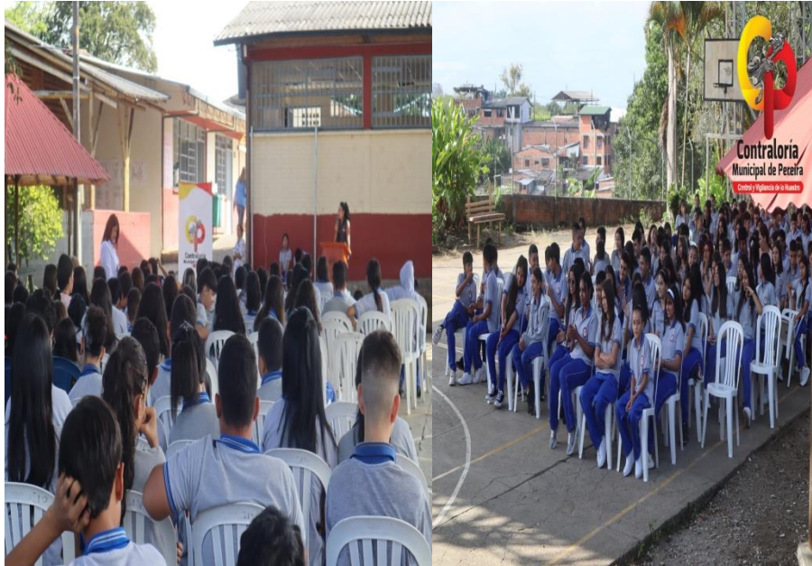
Registro fotográfico capacitación proceso de Elección Contralores y Personeros Estudiantiles